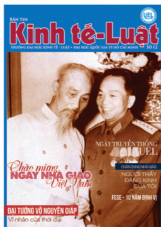
Ảnh bìa: “TÌNH THẦY TRÒ THIÊNG LIÊNG”

- Những gương mặt xuất sắc trong kỳ tuyển sinh đại học năm 2013