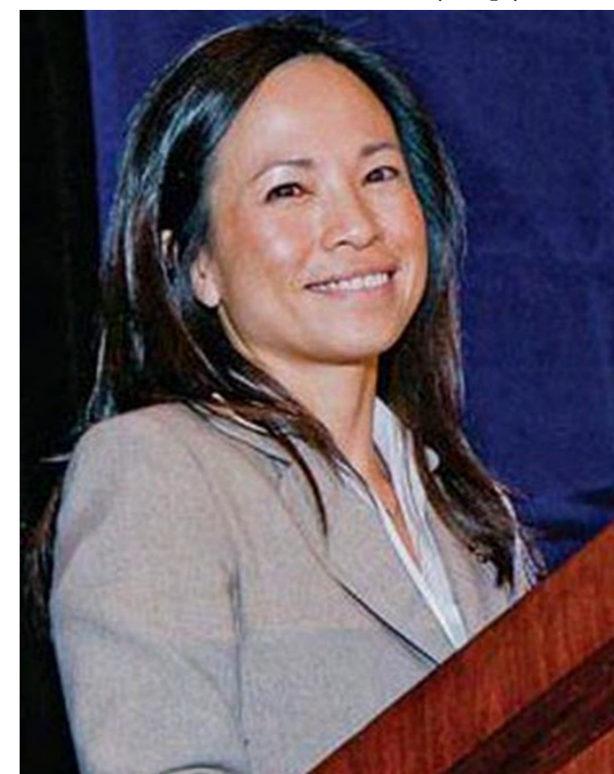
Giáo sư Nguyễn Thục Quyên - một trong 50 nhà khoa học có ngoại hình quyến rũ nhất do Bussiness Insider bầu chọn.

Nhân ngày Phụ nữ Việt Nam 20/10, chúng ta hãy cùng gửi tới phụ nữ cả nước – những người mẹ, người chị, người vợ, người em lời chúc tốt đẹp nhất. Và tin tưởng rằng các chị mãi là những người dệt gấm thêu hoa cho dân tộc Việt Nam muôn vàn yêu quý!